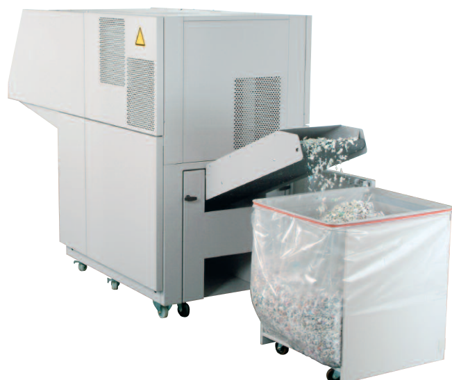
Transportband in Betrieb