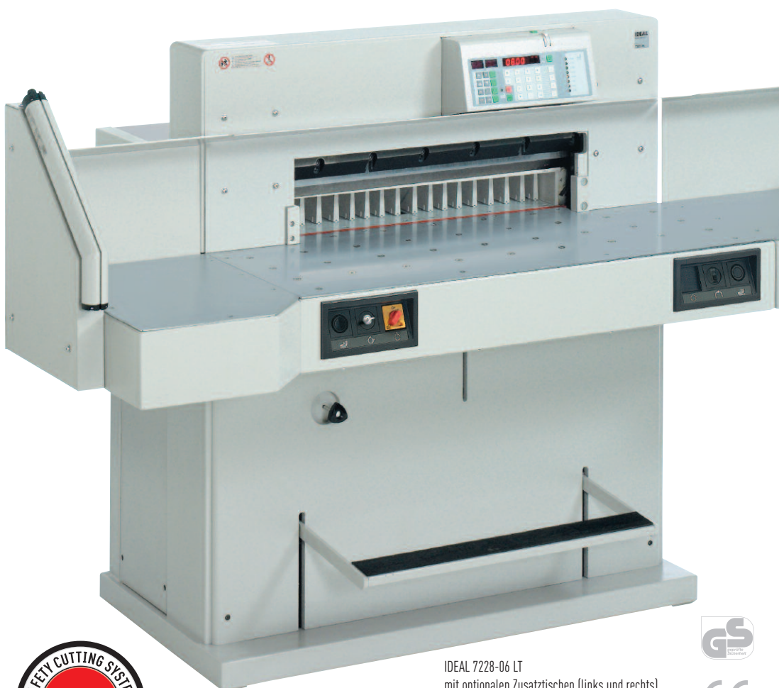
IDEAL 7228-06 LT mit optionalen Zusatztischen (links und rechts)

Netzanschluss: 400 Volt / 50 Hz / 3~ (Drehstrom), Motorleistung (Nennaufnahme): 1,5 kW Maße (H x B x T): 1335 x 1305 x 1510 mm, Maße mit Zusatztischen: 2100 x 1600 mm (B x T) Gewicht: 620 kg, Farbe perlgrau.